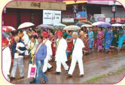
પ્રવેશની અમીવર્ષામાં ભીંજતા શ્રાવક-શ્રાવિકાઓ