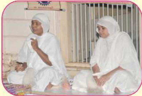
પૂ. સમ્યગગુણાશ્રીજી અને પૂ. શ્રુતગુણાશ્રીજી મ.સા.