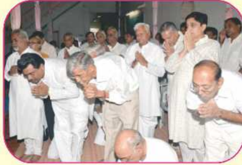
પૂજ્યશ્રીઓને સંઘનું સમુદ ગુરુવંદન