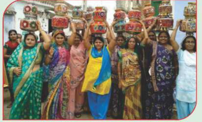
પૂજ્યશ્રીઓને શુકનવંતા બેડાંથી વધાવતી સૌભાગ્યવતી બહેનો અને નિયાણીઓ