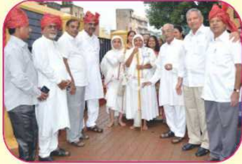
પૂજ્યશ્રી સાથે સંઘના મહાનુભાવો