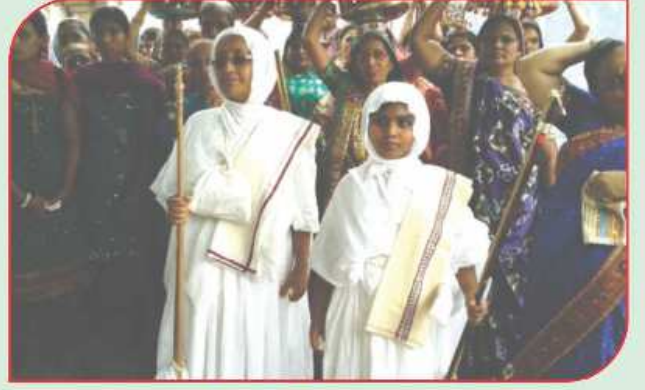
ચાતુર્માસ પ્રવેશે શાનદાર સામૈયું