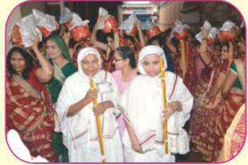
શણગારેલ બેડાંથી સ્વાગત કરતી સૌભાગ્યવંતી બહેનો