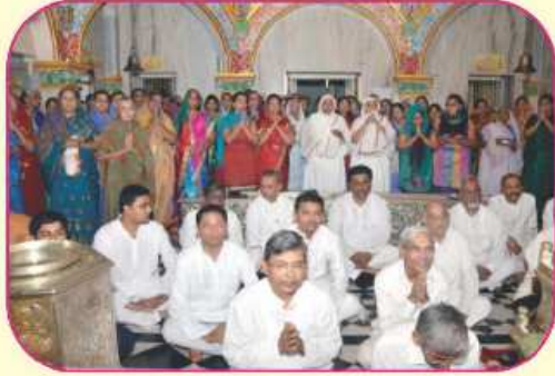
સંઘનું સામુહિક ચૈત્યવંદન