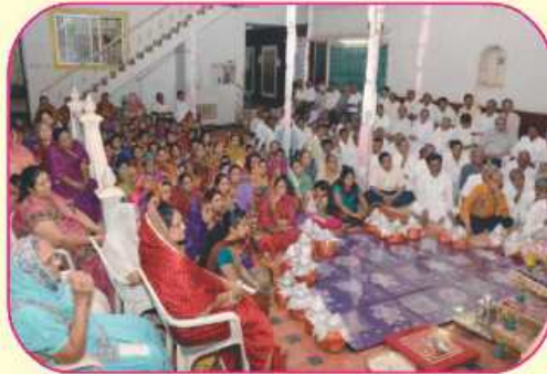
પ્રવચન શ્રવણ કરતા શ્રાવક-શ્રાવિકાઓ